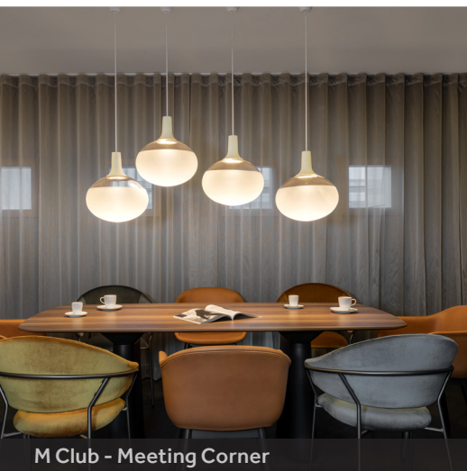
M Club - Meeting Corner