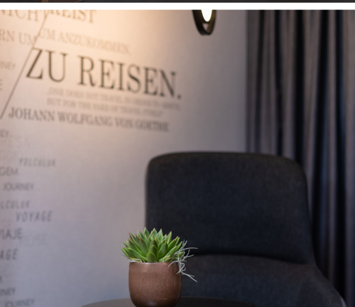
Reading Corner in M Club Suite